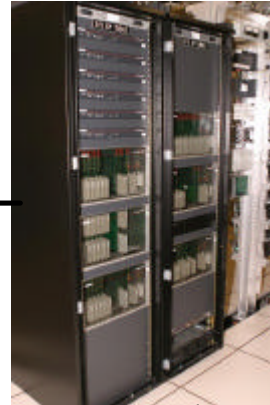
Zetron社製 基地局 コントローラー